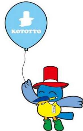
江東区民まつりキャラクター コトットちゃん

※無償化対象期間は当該児童の無償化対象となる期間であり、支給決定期間とは異なりますので、ご注意ください。