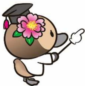
江東区観光キャラクター コトミちゃん

事故や病気などにより脳の言語中枢が損傷し、「話す」「書く」「聞く」「読む」といったことが困難になる障害です。