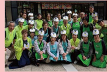
▲カメイドクロックでのPR活動

「この町が好きだから」誰に相談したらよいかわからない介護や高齢者のこと、子育てのことひとりで抱え込まず相談して下さい。