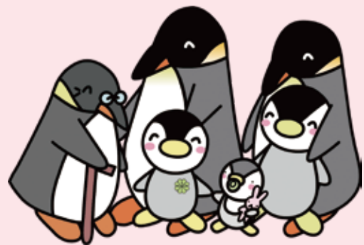
民生・児童委員のキャラクター「ミンジー」

A 民生委員法に守秘義務が定められています。 同意いただいていることを他の人に漏らすことはありません。