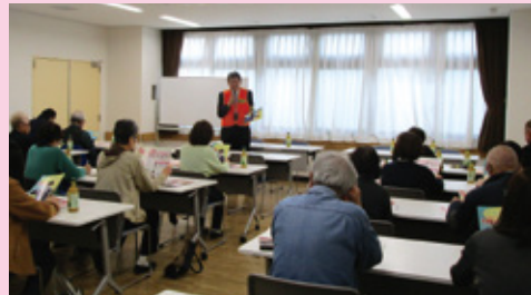
▲地区民生児童委員協議会の様子

時代に添い、AIにも即するように組織を見直します。「和を以って貴し」委員が協力して地域の皆さんに寄り添い、安心安全で暮せませよう頑張ります。