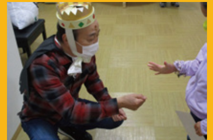
▲児童館のハロウィンイベント

「気安さ・心優しさ」を軸に下町の方々に声を掛けて貰える様に「つなげる」を合言葉に活動します。