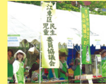
▲区民まつり大島地区でのPR活動