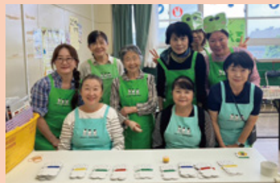
▲児童館のイベント参加

私たちは地域の「子育て応援団」です。身近な相談相手として、地域のこどもや子育て家庭の支援に取り組んでいます。