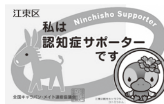
▲江東区の認知症 サポーターカード

そのため、何かを特別に行う必要はなく、友人や家族に知識を伝えたり、まち中や職場で認知症の方に出会った時にできる範囲で声かけや手助けをするなど、人によって活動状況もさまざまです。