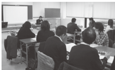
◀介護事業所職員を 対象とした講座

※企業、法人、団体の研修等で実施する場合には、テキスト代送料の実費をご負担いただきます。