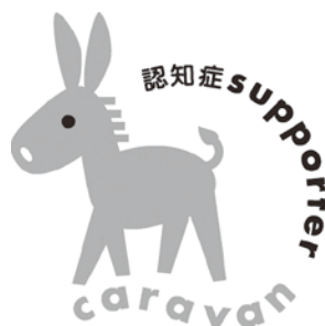
認知症サポーター キャラバンのマスコット 「ロバ隊長」

また、認知症の方やその家族が安心して地域での生活を営んでいくためには、 認知症についての正しい知識と理解を地域において広めていくことが大切です。