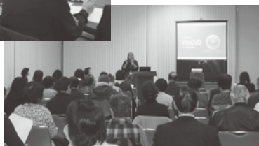
▶地域の方を 対象とした講座

これまでに開催された養成講座の様子の一部です。対象者・目的により、講座形式・内容も様々です。興味のある方はぜひ一度ご相談ください!!