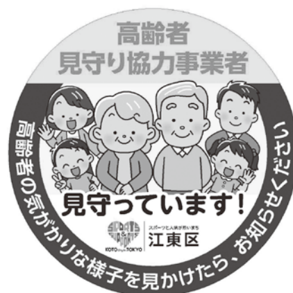
見守りステッカー

協力事業者には「見守りステッカー」をお渡しするとともに、事業者名等を区のホームページに掲載（任意）しています。