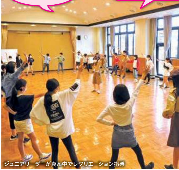
ジュニアリーダーが真ん中でレクリエーション指導