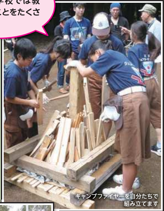
キャンプファイヤーを自分たちで組み立てます

JLではさまざまな活動に参加し、時には企画運営も行います。みんなで話し合いながら、1つの目的に向かって協力することでチームワークの大切さを学ぶことができます。JLは多くの仲間がいてたくさん話す機会があるため、自然と人と話すのが好きになりました。