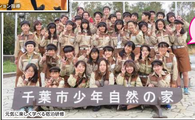
元気に楽しく学べる宿泊研修

地域の大人たち、JLの仲間たちと一緒に地元イベントを盛り上げます。地域のイベントに携われた達成感と「今年もありがとう!来年もよろしくね!」と地域の人たちから感謝され、JLがますます好きになりました。