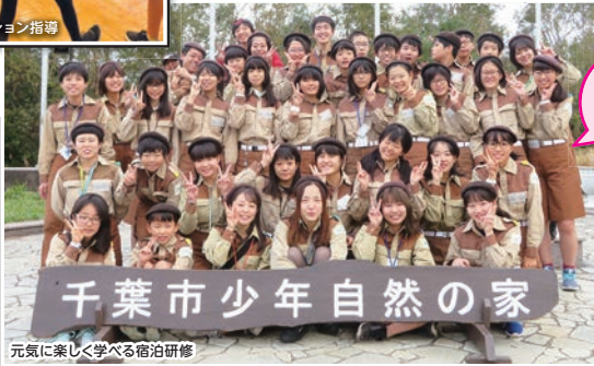
元気に楽しく学べる宿泊研修

地域の大人たち、JLの仲間たちと一緒に地元イベントを盛り上げます。地域のイベントに携われた達成感と「今年もありがとう!来年もよろしくね!」と地域の人たちから感謝され、JLがますます好きになりました。