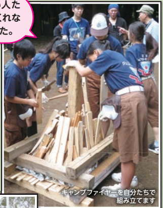
キャンプファイヤーを自分たちで組み立てます

JL(※)ではさまざまな活動に参加し、時には企画運営も行います。みんなで話し合いながら、1つの目的に向かって協力することでチームワークの大切さを学ぶことができます。JLは多くの仲間がいてたくさん話す機会があるため、自然と人と話すのが好きになりました。