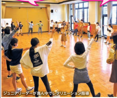
ジュニアリーダーが真ん中でレクリエーション指導