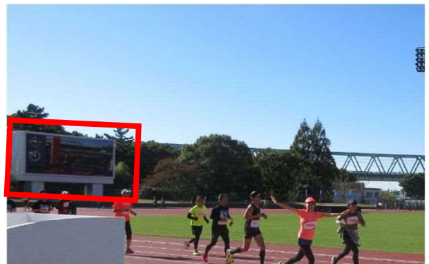
競技場大型モニターでCM放映 （プラチナ・ゴールド）