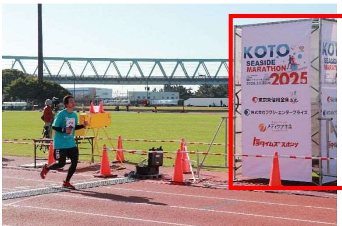
マラソンゲート（側面に企業ロゴ掲出） （プラチナ・ゴールド）