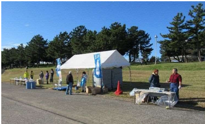
給水所のネーミングライツ（企業ののぼりや看板を設置） （先着3企業）