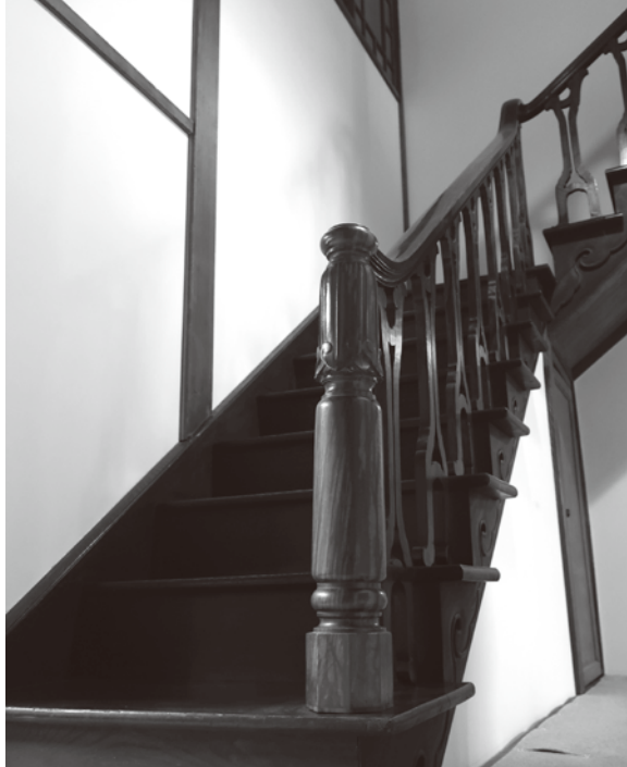
「表座敷」黒柿の階段