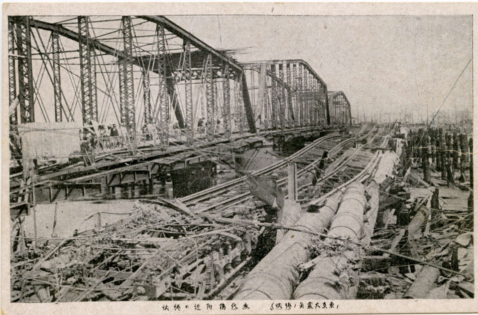
状況。近附橋。永代橋 (状況。大震災東京)

大正12年(1923)の関東大震災では、江東区の西部(深川区)がほぼ全焼し、火災を免れた東部(城東区)に多くの被災者が避難しました。当時の地域住民が置かれた状況と災害に立ち向かった様子、地域の歴史を紹介します。