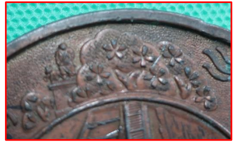
上野公園 (桜と西郷隆盛像)