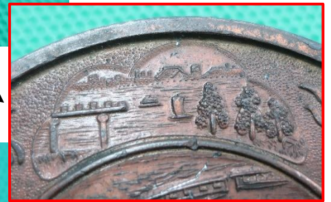
隅田川と沿岸の街並