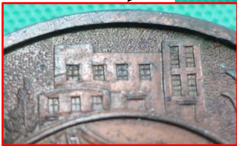
不明 (コンクリート造建物)