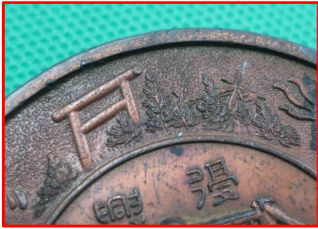
靖国神社 (鳥居と社殿の屋根)