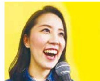
6歳から80代までの幅広い生徒が通う人気教室。生徒からは「高音がきれいに出了」「歌仲間ができた」など喜びの声が

人前で歌えるようになりたい、カラオケがうまくなりた、持ち歌を作りたいなら「USボーカル教室」でボーカルレッスンを受けてみませんか。10/31(木)まで「オータムキャンペーン」を実施中。期間中に「本誌を見た」と申し込むと、月2回の個人レッスンの初回月謝通常1万800円が3000円引きに。グループレッスンやペアレッスンの初回月謝割引もあります。パーベキューや発表会などイベントも多数開催。30分ボーカル無料体験レッスンで、雰囲気を確認してみてください。