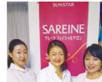
「おかげさまで今秋10周年! 隠れ家的でアットホームなサロンです。ぜひお気軽にお越しくださいませ」とスタッフ

デントルケア製品などでおなじみ、サンスターのエステブランド「サレーヌ フェイシャルサロン 木場店」では、独自のサロンコスメを使い、一人一人の状態に応じてハンド中心でケアします。首からリンパに沿ったマッサージでリラックス。「美白+小顔+首までのスペシャルケア」のほか、お悩み別コースもあります。忙しい毎日をごんばっている自分へのごほうびに、また夏の疲れを癒やすために、エステで至福のひとときを過ごしませんか。