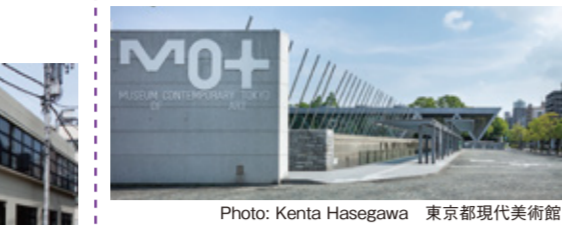
東京都現代美術館

■(休館日)月曜日(祝日の場合は翌日)、年末年始、 展示替え期間 ■(入館料)無料(観覧料)コレクション展一般500円 ほか※企画展は展覧会により異なる