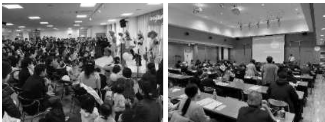
左：こうとう子育てメッセ、右：児童虐待予防プログラム （資料：ママリングス）