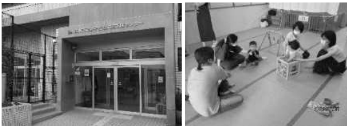
左：子ども家庭総合支援拠点、右：子育てひろば