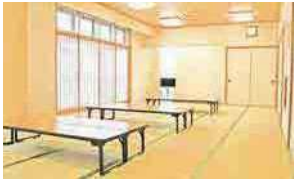
和室 規模：25畳 定員：40人