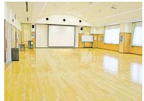
タウンホール 規模：178.6㎡ 定員：150人