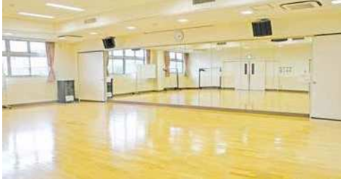
ホール 規模：130.99㎡ 定員：110人