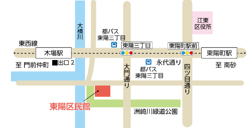
所在地 東陽3-1-2 TEL:03-3645-8651 東西線 木場駅 出口2より徒歩3分 都バス 東陽三丁目下車 徒歩3分