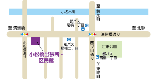
所在地 嘉橋2-1-5 TEL:03-5606-5581 都バス 嘉橋二丁目下車 徒歩3分