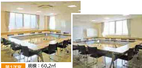
第1洋室 規模：60.2㎡ 定員：45人