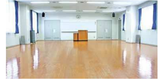
ホール 規模：120.1㎡ 定員：100人