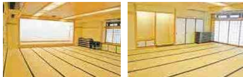
第1和室 規模：40畳 定員：60人