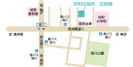
所在地 北砂4-7-3 TEL:03-3644-2181 都バス 境川下車 徒歩3分