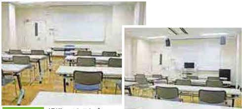
第1洋室 規模：48.79㎡ 定員：35人