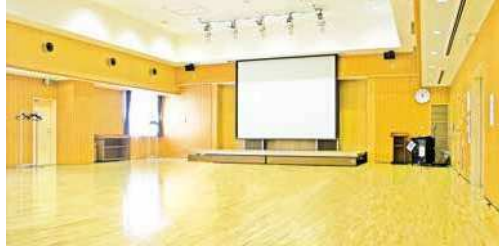
タウンホール 規模：210㎡ 定員：175人