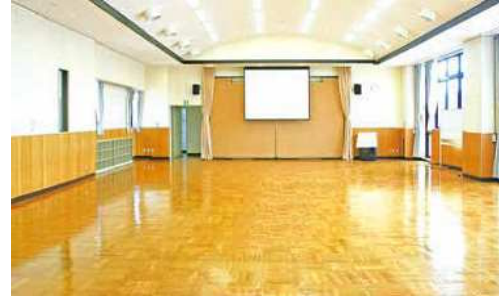
タウンホール 規模：178㎡ 定員：150人