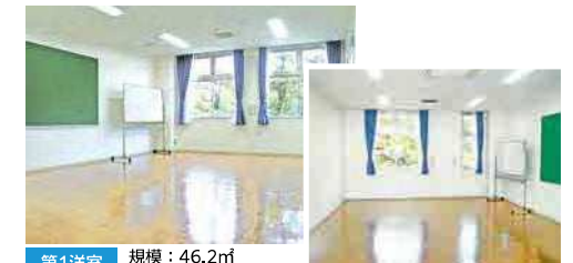
第1洋室 規模：46.2㎡ 定員：35人