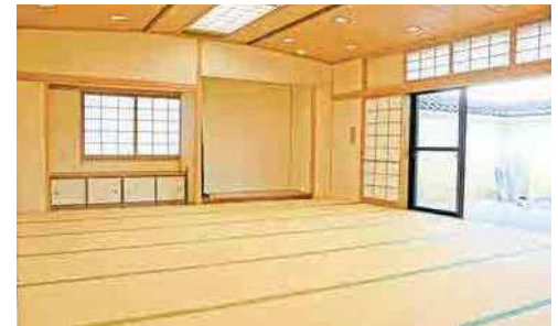
和室 規模：24畳 定員：40人