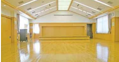
ホール 規模：120.7㎡ 定員：120人