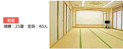
和室 規模：25畳 定員：40人