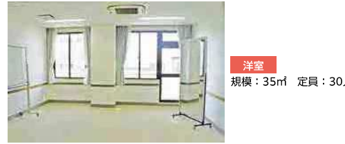
洋室 規模：35㎡ 定員：30人