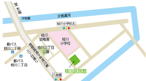
所在地 枝川3-6-16 TEL:03-3647-6852 都バス 枝川二丁目下車 徒歩5分