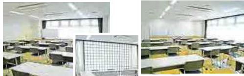
第1洋室 規模：84.1㎡ 定員：55人