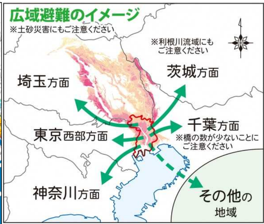
広域避難のイメージ