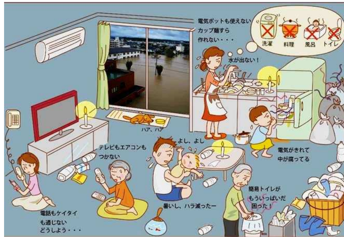
自宅にとどまった場合の生活環境イメージ

広域避難せずに自宅にとどまるとイメージ図のようなことが起こります 台風が発生する暑い時期に2週間以上も耐えられるでしょうか？