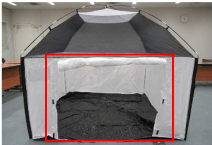
【目隠しシートなし・入口開き】