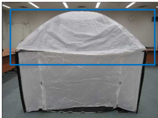
【目隠しシート付・入口閉め】