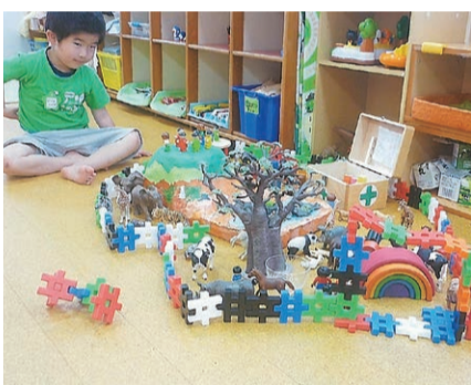
魅力的な遊具に興味津々で遊んでいます