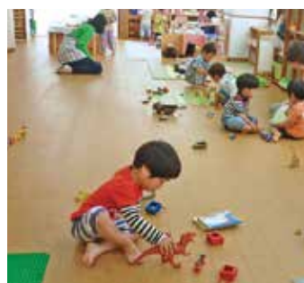
魅力的な遊具に興味津々であそぶ子ども達

おともだちと一緒に楽しい時間が過ごせるように遊具の配置を工夫し、また、「ミニ運動会」「クリスマス会」等、季節行事も取り入れています。毎月保育