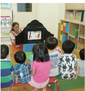
紙芝居やパネルシアターを行っています。