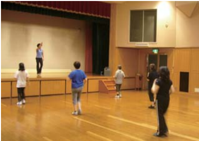
▲【レクホール】電動椅子(205席)を出せば発表会等にも利用できます。

江東区パルカレッジは、仲間と共に約1年間近くにわたって男女共同参画の視点を学び、自分の生き方や家族・地域との関わりについて考える学習講座です。