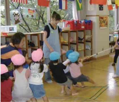
運動会の雰囲気、つなひきをする幼児と保育者。季節の行事や避難訓練を実施しています。

保育にあたっては、お子さんが楽しく安心感を持って集団保育を体験できるように、安全面に配慮すると共に、短時間保育（2時間を限度）の中で、季節の行事を取り入れるなどの工夫をしています。