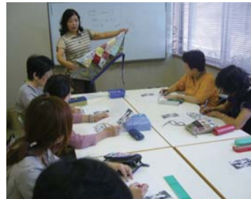
▲【会議室・研修室】会議や研修会をはじめ、サークル活動等にご利用ください。