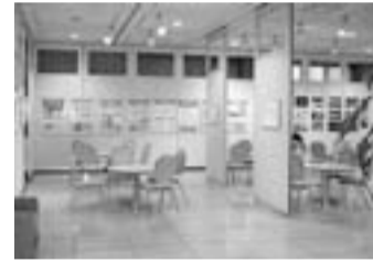
◀明るい展示ロビー