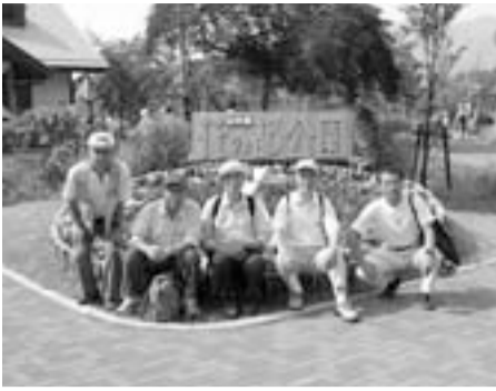
「親睦を深めながら男性問題を学習」

10年前に現在の男女共同参画推進センターで開催された「男性学講座」の修了生(男性のみ)で結成したグループです。毎月第3金曜日の19時から約2時間、推進センターに集まり、男性問題に関する学習会等、会員相互の研さん及び親睦を深めています。恒例は年末の「男の料理懇親会」で、会員が一生懸命作った料理で、妻たちをもてなしています。毎年、好評です。 【問】 ☎3615-0122 FAX 3615-0122 Eメール: kxb02512@nifty.com