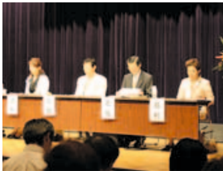
パネリストの皆さん