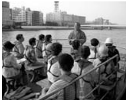
地域の豊かな暮らしのために

本所深川を愛する地元商店主、小学校や大学の教員、主婦、学生などがメンバーとなり、歴史や文化を大切にしながら、地域の豊かな暮らしを実現するために活動しています。今年9月からは、月1回、江戸前の寿司や芭蕉、小名木川の船遊山、忠臣蔵、相撲部屋と深川七福神をテーマとしたまち巡り「本所深川漫歩」を実施中です。詳しくはホームページをご覧ください。 【問】 ☎3631-2008 http://honfukaka191.xrea.com/