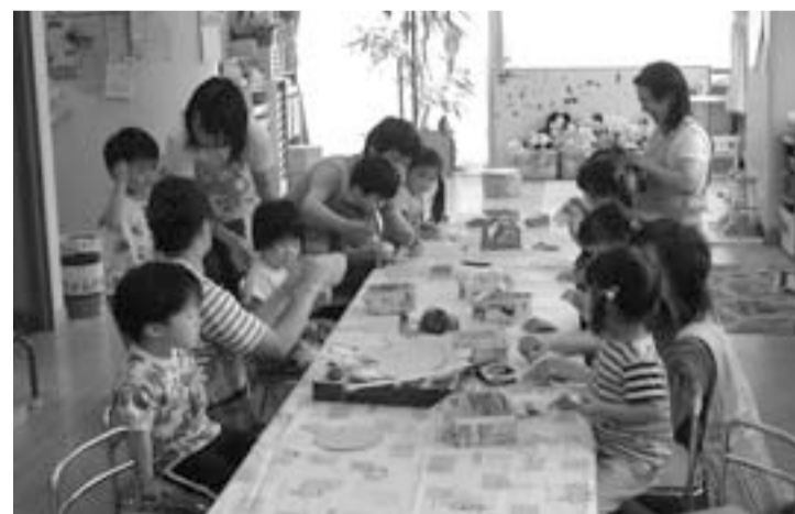
▲さくらんぼ保育室での楽しいひととき

をしながら保育者資格取得にチャレンジしたり、任期終了後に、地域で保育関連の仕事に就いたり、さらにはお話し会で活躍したり、パネルシアターの本を出して、パネルの教室を開かれた方もいます。 平成17年度には、初めての男性保育者を迎え、保育室も「男女共同参画」に一歩近づいたところです。男性保育者は、子どもたちにも大人気です。