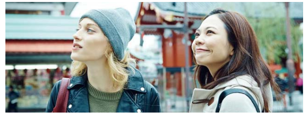
外国からの来訪者を“おもてなし”