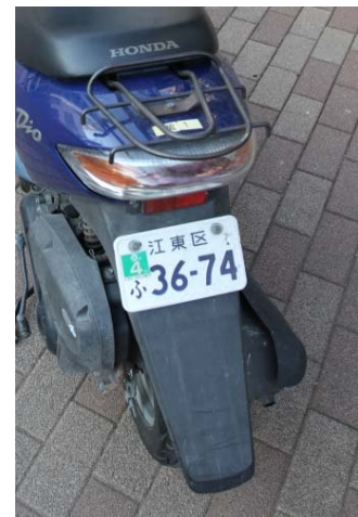
原動機付自転車で区の魅力をPR！ (写真は従来のナンバープレート)