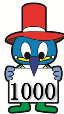
江東区民まつりマスコット コトトちゃん