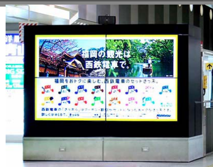
大型モニター(イメージ)