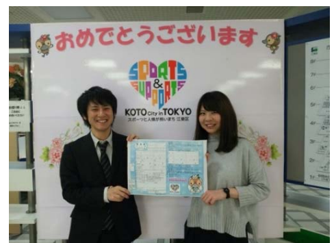
メモリアルボード(区役所2階)

長期計画の該当項目：計画の実現に向けて(2) スリムで区民ニーズに的確に対応した行財政運営