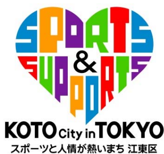
江東区ロゴマーク