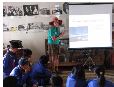
派遣先で現地の方と交流(イメージ)