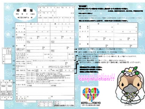
オリジナルデザイン入り婚姻届