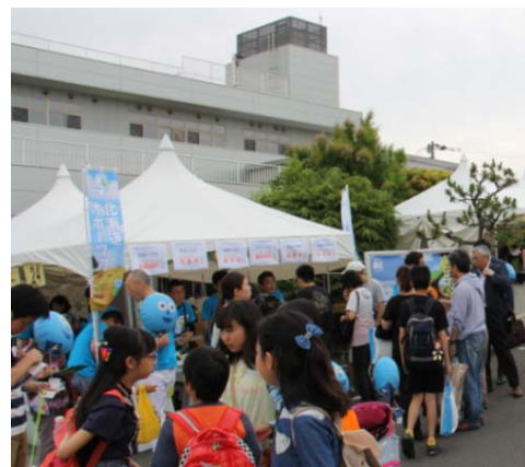
第9回環境フェア(平成28年6月開催)