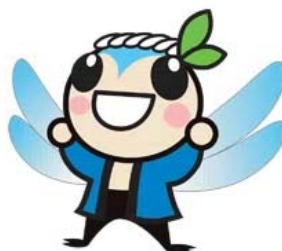
えこつくる江東キャラクター 「たすけくん」