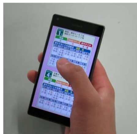
スマートフォン用アプリ（イメージ）