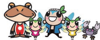
▲えこっくる江東環境学習情報ナビゲーター「たすけくん」と仲間たち