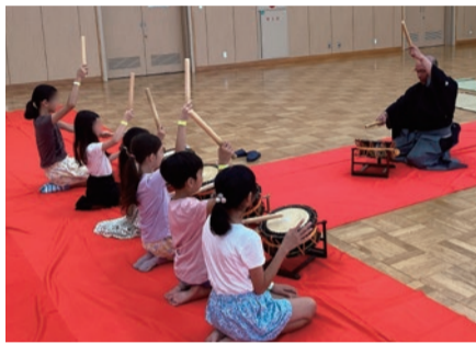
▲伝統芸能(能楽)体験ひろば