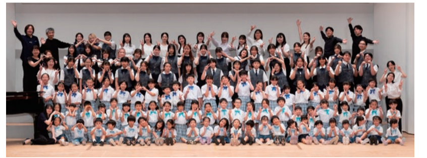
▲江東少年少女合唱団の皆さん