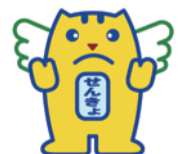
▲選挙のめいすいくん