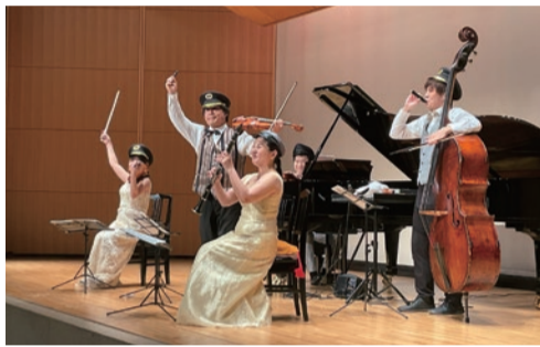
▲わくわくコンサート