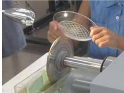
▲江戸切子の体験の様子