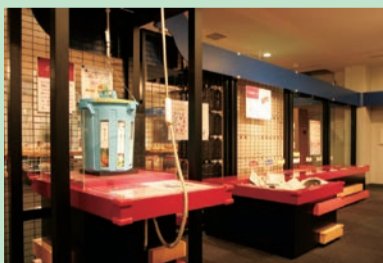
▲仕掛けいっぱいの展示