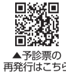
▲予診票の再発行はこちら

いずれも 接種時は、通知に同封の予診票を必ず持参してください。紛失、汚損の場合は再発行できますので、再発行の申込フォーム(右記2次元コード)から申請してください。