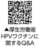
▲厚生労働省HPVワクチンに関するQ&A