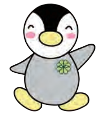
▲東京都民生委員・児童委員キャラクター「ミンジー」