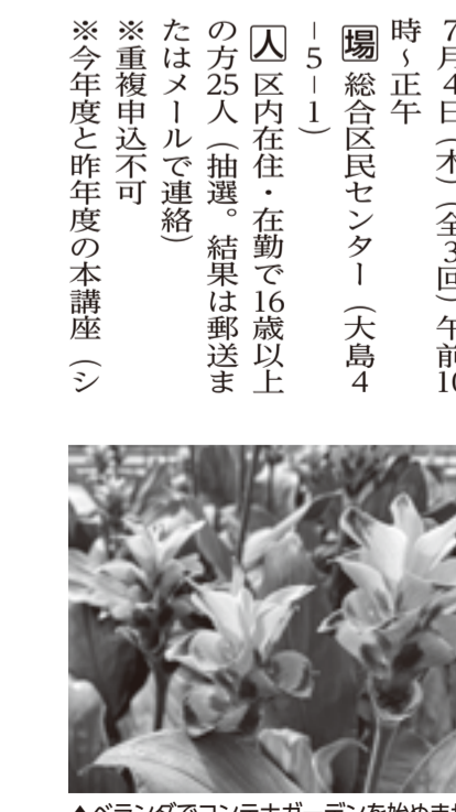
▲ベランダでコンテナガーデニングを始めませんか

外 【費】 6,000円(材料費) 【師】 矢澤秀成(園芸研究家) 【締切】 5月13日(月)必着 【申】 区ホームページ、または往 復はがきに①講座名②氏名(ふ りがな)③住所(区内在勤の方 はその旨)④電話番号⑤年齢を 記入し、〒135-8383区役所管理課 CIG推進係へ ☎(3647)2079 FAX(3647)8454