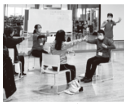
▲令和5年度介護予防リーダー養成講座の風景

江東区オリジナルの介護予防 ます。 【場】 スポーツクラブルネサンス 北砂(北砂2-16-1) 【入】 区内在住で、地域で介護予 防活動を行う意欲があり、プロ グラム全回に参加できる方20人 (抽選) 【費】 無料 【内】 実技KOTO活き粋体操、 体力測定の実施など 【講義】 介護予防・転倒予防、栄 養と口腔機能、高齢者が運動を 行う際の注意、認知症予防・対 応、区の高齢者の実態、CPR 講習