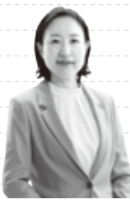
江東区長 大久保 朋果 ▲旧中川でカヌーの練習をするこどもたち