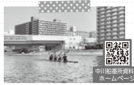
中川船番所資料館 ホームページ