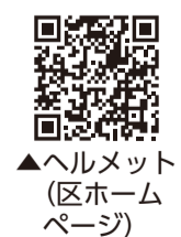
▲ヘルメット(区ホームページ)

※最新の情報や店舗等の詳細は、区ホームページをご覧ください。※在庫状況は店舗により異なります。