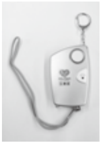
▲防犯ブザーイメージ