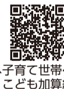
▲子育て世帯へのこども加算給付