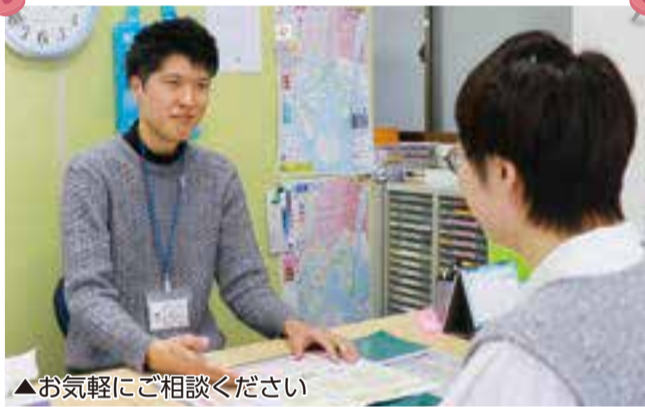
▲お気軽にご相談ください