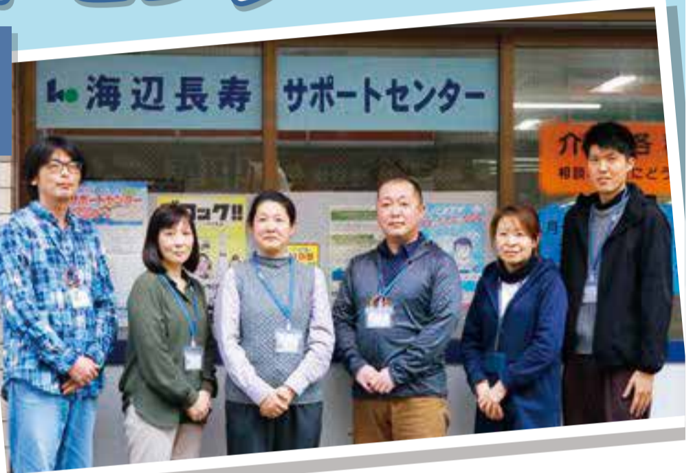
▲あなたの身近な相談窓口です(海辺長寿サポートセンターのスタッフの皆さん)