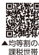
▲均等割のみ課税世帯

エネルギー・食料品価格等の物価高騰による負担増を踏まえ、特に家計への影響が大きい低所得世帯(住民税非課税世帯)に対して、令和6年1月から江東区物価高騰重点支援給付金(追加給付分・7万円)を給付しています。今回、これに加えて、国の「物価高騰対応重点支援地方創生臨時交付金」を活用して、下記①・②の給付金を支給します。