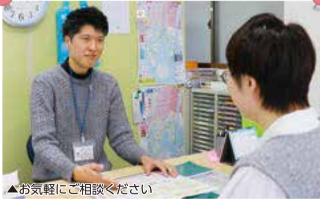
▲お気軽にご相談ください