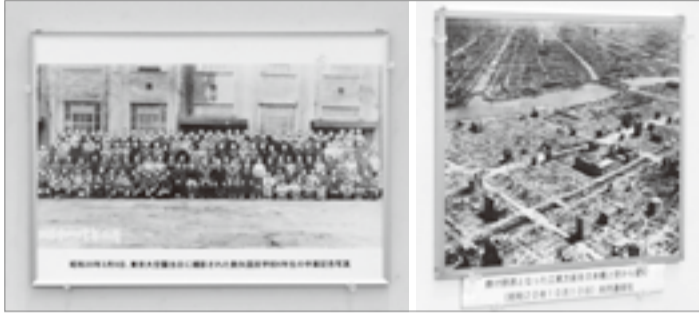
▲今年も東京大空襲・学童集団疎開した子どもたちの写真などを展示

[二] 一般向け上映会 [時] 3月2日(土) 午後1時～1時40分 [人] 20人程度(先着順)