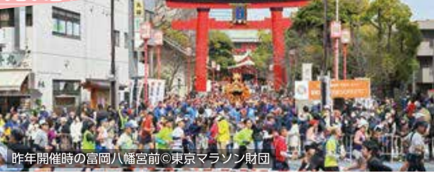
昨年開催時の富岡八幡宮前

東京マラソン2024が3/3(日)に開催されます。約38,000人のランナーが都庁をスタートし、区内の清澄通り、永代通りを駆け抜け、富岡八幡宮先で折り返し、東京駅前・行幸通りを目指します。周辺では交通規制が行われるほか、イベントも開催されます。