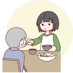
障害や病気のある家族の身の回りの世話をしている。

シンポジウムでは、元ヤングケアラーの方から体験談や当時の気持ちなどをお聞きし、ヤングケアラーの現状や課題、今後の支援のあり方を考えます。今、悩んでいる中高生世代の方や、子どもを支える地域の方々、ぜひご参加ください。