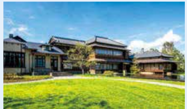
▲旧渋沢家住宅