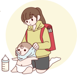
家族に代わり、幼いきょうだいの世話をしている。