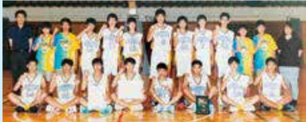
▲仲の良さが自慢の深川一中男子バスケットボール部の皆さん

入学時からコロナ禍で思うように練習できず、大会が中止になったりと苦しい時期が続く中、できることをひたむきに取り組んできた皆さん。「新人戦で悔しい思いをしたので、チームづくりと練習に励みました。準決勝では強豪校を破って、深川一中初となる決勝の舞台に立つことができ、本当にうれしいです」と話してくれました。