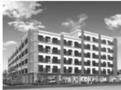
▲特別養護老人ホーム外観イメージ

ブにおいても医療的ケア児の受け入れを開始するとともに、必要な情報を一元的に記載したガイドブックを作成します。