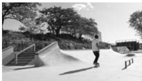
▲夢の島スケートボードパーク

今後は、他のレガシー施設も有効活用し、スポーツを通じた区民の健康づくりの促進や、こどもたちの体力向上を積極的に進めてまいります。