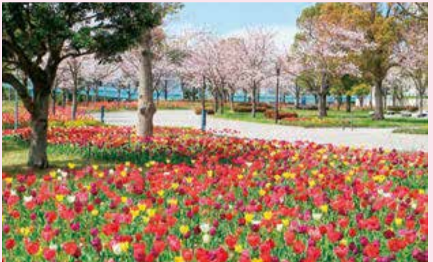
▲シンボルプロムナード公園の桜とチューリップ

今回は、湾岸エリアの春めく季節に合わせてまちあるきツアーを開催します。花と緑と水に囲まれ、咲き誇る桜と、色とりどりのチューリップのコラボレーションがとても魅力的なシンボルプロムナード公園を、文化観光ガイドの解説とともに楽しくまちあるきを試みませんか。まちあるき終了後はTOKYOミナトリエを見学できます。