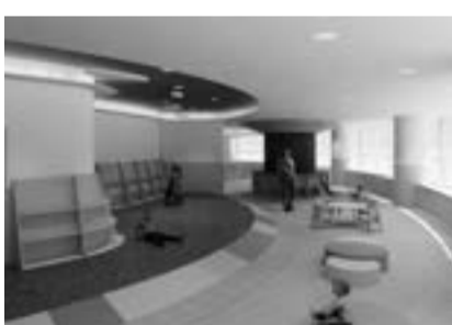
▲(仮称)有明こども図書館絵本コーナーイメージ

有明スポーツセンターのレストラン施設跡地を活用してこども向け図書館を整備するとともに、24時間どこからでも本を借りられる電子図書館サービスを導入します。