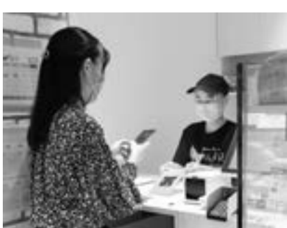
▲電子商品券での支払いイメージ

商業振興では、プレミアム率30%の区内共通商品券を紙および電子で発行し、物価高騰等の影響を受ける家計の応援と、未だ回復途上である地域経済の活性化に取り組んでいきます。