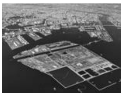
▲開発が進む臨海部

都市計画マスタープランにおいては、「未来の臨海部のまちづくり」を重点戦略に掲げ、スポーツ、テクノロジー、自然が共生する湾岸軸を形成することとしています。そこで、臨海部の都市交通のあり方を示すビジョンを策定し、関係機関や交通事業者等と共有することで、臨海部へのアクセス性や回遊性の向上を図るなど、ベイエリアの魅力を活かした夢のある将来のまちづくりを進めてまいります。