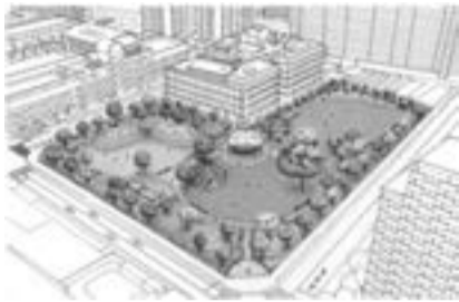
▲(仮称)大島九丁目公園整備イメージ

(仮称)大島九丁目公園の整備については、区民と一緒にゼロからつくる公園をコンセプトに、区民参加イベントを行いながら、コミュニティ醸成につながる公園整備を進めていきます。