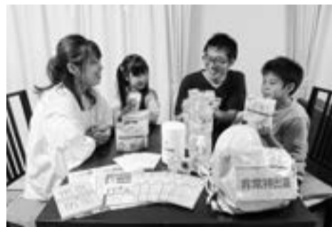
▲防災カタログギフトを全世帯へ配付