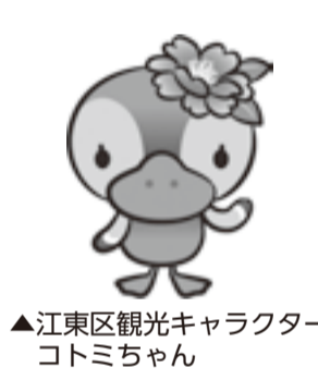
▲江東区観光キャラクター コトミちゃん