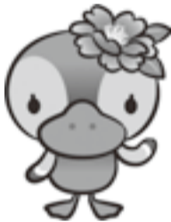
▲江東区観光キャラクター コトミちゃん

※単位はμg/m 3 μg/m 3 : 大気1立方メートル中に100万分の1グラム含まれていることを示す