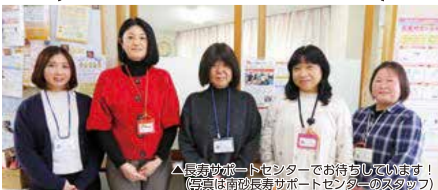
▲長寿サポートセンターでお待ちしています！ (写真は南砂長寿サポートセンターのスタッフ)