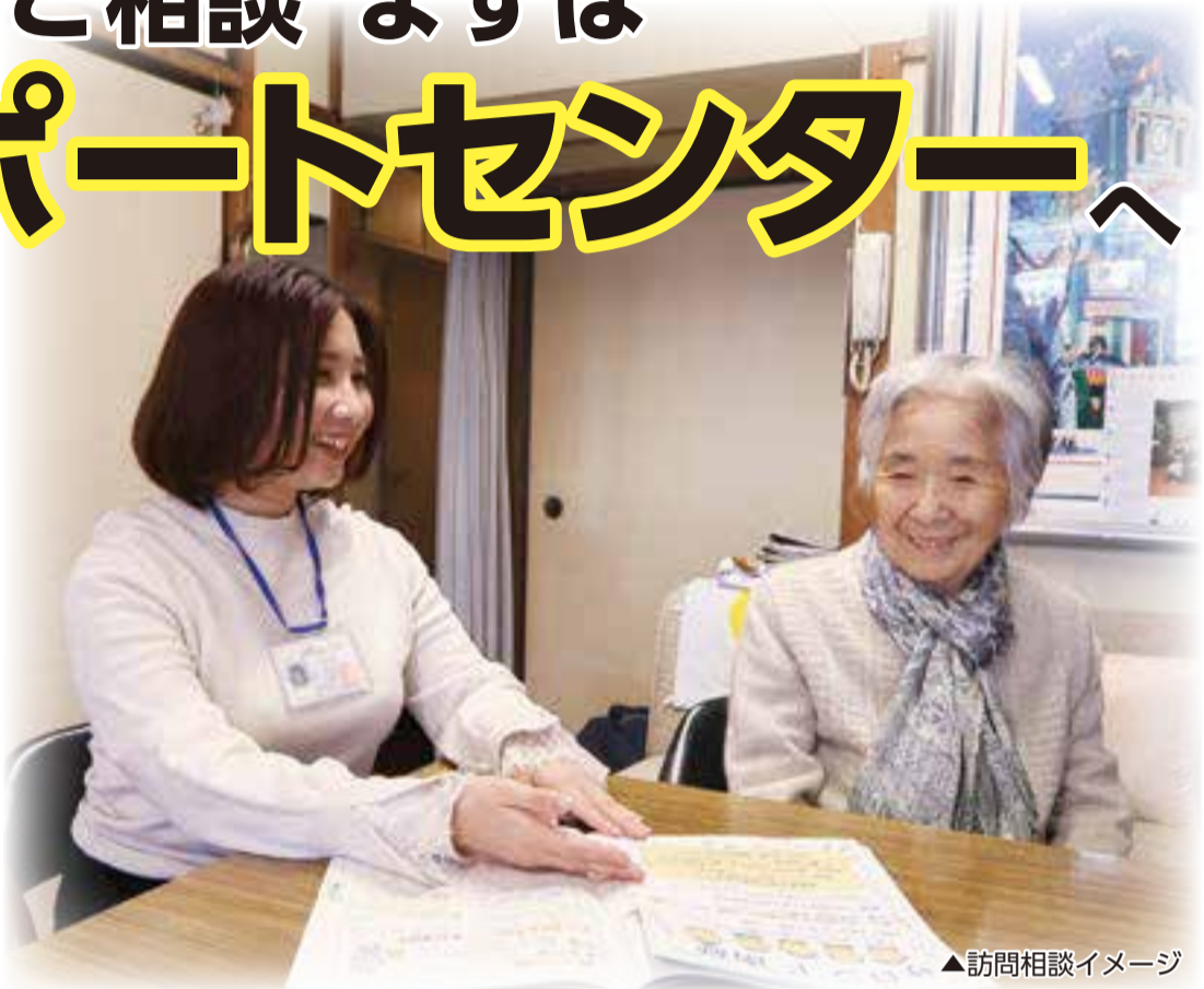
▲訪問相談イメージ