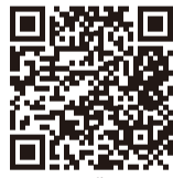
▲江東ボランティア・センター 各種講座

ジ申込フォーム、または電話で江東ボランティア・センター(月)金曜午前9時~午後7時) ☎ 3645-4087 HP https://koto-shaky.o.or.jp/volunteerc/koza.html