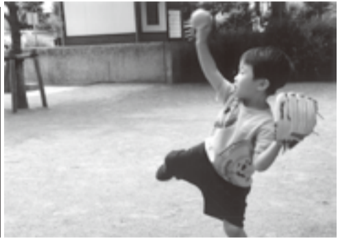
弟が 投げた一球 夏へ飛ぶ

昭和を代表する俳人・石田波郷が俳句と写真でつづった「江東歳時記」にちなみ、俳句と写真を募集した「こども江東歳時記」に、全国から329作品の応募があり、石田波郷記念館「江東歳時記」賞のほか、受賞作品が決定しました。 受賞作品は、砂町文化センターホームページで公開しています。 砂町文化センター ☎ 3640-1751 FAX 5606-5930 HP https://www.kcf.or.jp/sunamachi/