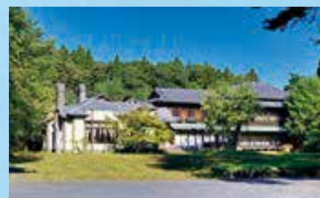
▲青森県六戸町時代の旧渋沢邸