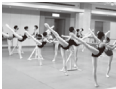
▲オーディションの様子

和5年4月現在) ⑤経験年数 ⑥身長 ⑦所属バレエ教室 ⑧保護者名 ⑨郵便番号・住所 ⑩電話番号を記入し、〒135-0002 住吉2-28-1 36ティアアラこうとうジュニアバレエ教室係へ ☎ 3635-5500 FAX 3635-5547