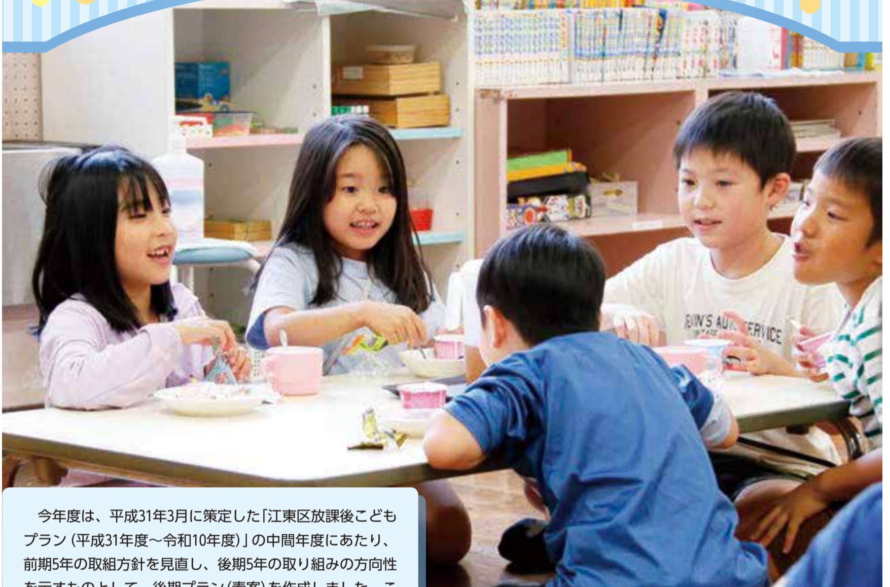
▲みんなで楽しくおやつタイム!(きっずクラブB登録)

今年度は、平成31年3月に策定した「江東区放課後こどもプラン(平成31年度～令和10年度)」の中間年度にあたり、前期5年の取組方針を見直し、後期5年の取り組みの方向性を示すものとして、後期プラン(素案)を作成しました。このたび、その概要をお知らせするとともに、パブリックコメント(意見募集)を実施します。皆様のご意見をお待ちしています。