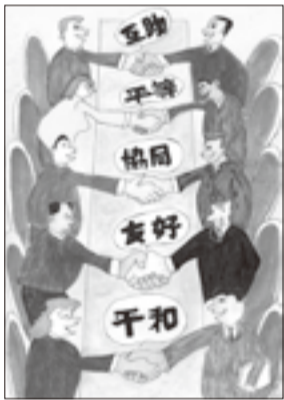
ジュニア大賞・区長特別賞