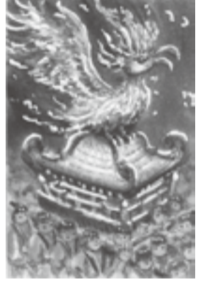
イラストの部 一般大賞