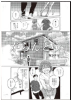
ストーリー漫画の部 一般大賞