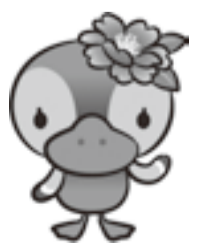
▲江東区観光キャラクター コトミちゃん

「相談窓口」 ○深川地区、東砂6、8丁目、南砂、新砂、海の森 ○保護第一課(区役所2階24番) ☎(3645)3106 ☎(3647)4917 FAX(3647)4917 ○亀戸、大島、北砂、東砂1、5丁目、夢の島、新木場、若洲 ○保護第二課(大島4-5-1総) 合区民センター1階 ☎(3637)2707 FAX(3683)3722