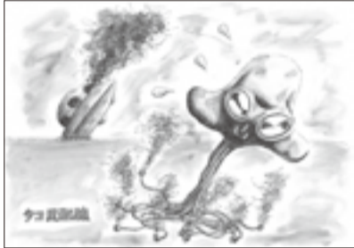
コマ漫画の部 一般大賞