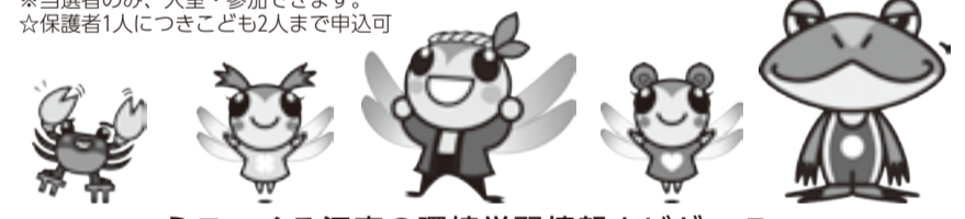
えこくる江東の環境学習情報ナビゲーター

えこくる江東クイズラリー 土・日曜を中心に開催中。冬休みは12/26(火)・27(水)、1/5(金)も開催。参加者には景品を進呈 区民センター(小・中・高)でも開催(小学生以下の方は要保護者同伴) 無料 申 当日直接えこくる江東2階事務室へ