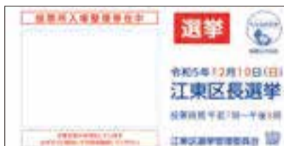
「投票所入場整理券」封筒