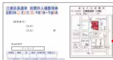
ご自身の「投票所入場整理券」表面

誤って、ご家族の入場整理券をお持ちにならないようご注意ください。 この地区は、12月10日(日)投票日当日にお越しになる場合の投票所です。