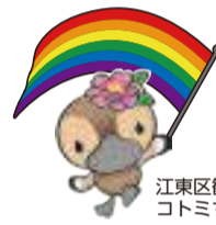
江東区観光キャラクター コトミちゃん