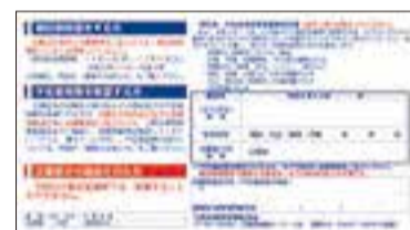
ご自身の「投票所入場整理券」裏面

誤って、ご家族の入場整理券をお持ちにならないようご注意ください。 この地区は、12月10日(日)投票日当日にお越しになる場合の投票所です。