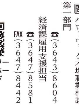
▲ハローワーク木場ホームページ