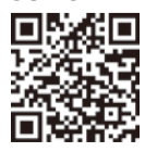
東京舟旅ホームページ

豊洲～日本橋航路の運航開始 船で通勤や日常の移動がさらに便利になります。詳細はホームページをご覧ください 時 10/25(水)～(火～木曜の夕方のみ) [コース] ららぽーと豊洲船着場～日本橋 費 片道500円 申 東京舟旅ホームページで 問 [運航について] 観光汽船興業(株) HP https://www.urbanlaunch.net/email2/ [その他] 東京都都市整備局交通企画課交通プロジェクト担当☎5388-3392 e S0000178@section.metro.tokyo.jp HP https://www.suitown.jp/cruise/234/