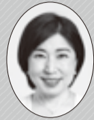
江東区長 木村 弥生