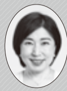
江東区長 木村 弥生