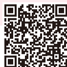
▲防災マップ (区ホームページ)

防災マップの裏面には、災害時の対処法や地震時の行動マニュアルなども紹介していますので、災害時の行動の確認にご活用ください。